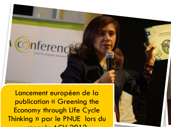
Lancement européen de la publication « Greening the Economy through Life Cycle Thinking » par le PNUE lors du congrès ACV 2012