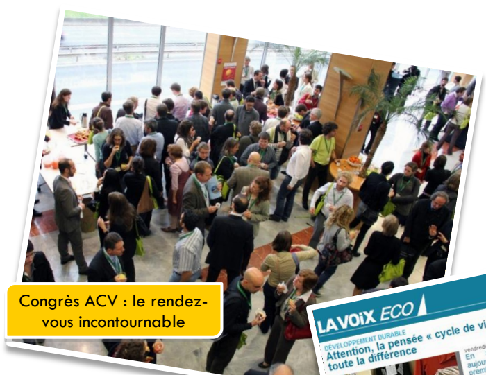
Congrès ACV : le rendez-vous incontournable