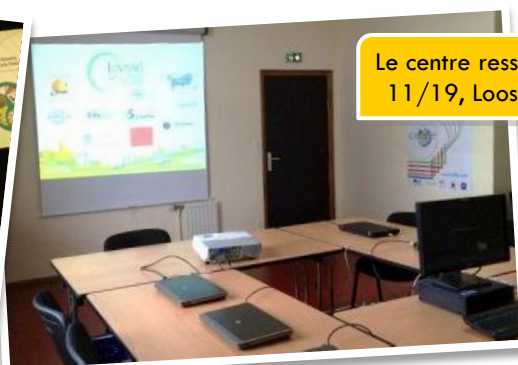
Le centre ressource à Base 11/19, Loos-en-Gohelle

* Services en accès limité pour les membres hors de la région Nord-Pas de Calais