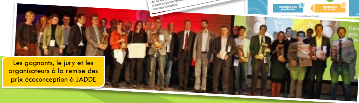
Les gagnants, le jury et les organisateurs à la remise des prix écoconception à JADDE