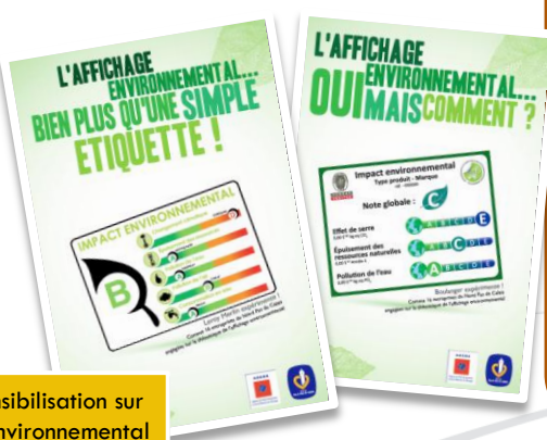
Outils de sensibilisation sur l'affichage environnemental

Cette action vise également à soutenir et à mettre en valeur les entreprises régionales engagées dans l'affichage environnemental (et non uniquement celles dans l'expérimentation nationale).