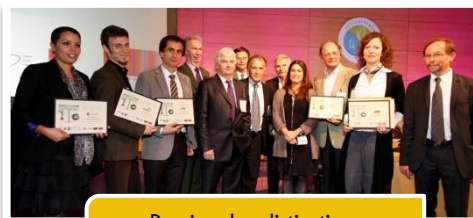
Remise des distinctions écoconception à JADDE 2011

Téléchargez le dossier de candidature sur www.avnir.org Date limite de dépôt : 29 juin 2012.